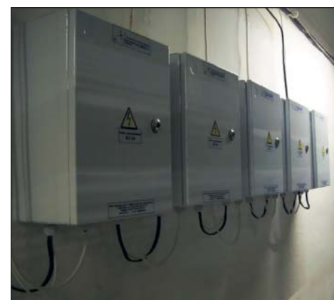
Рис. 8. Блоки сопряжения из состава светодиодной системы освещения ИСО «Хамелеон». Металлический шкаф обеспечивает оптимальный температурный режим работы электронного оборудования для максимального продления срока службы

Наша компания первой в России создала и в промышленных масштабах приступила к выпуску светодиодных систем освещения для сельского хозяйства. В частности, об этом свидетельствует полученный совместно со специалистами ВНИТИП г. Сергиев Посад приоритет на изобретение способа содержания сельскохозяйственной птицы. Благодаря особенностям применения светодиодные источники света, как показывают научные исследования, проводимые во Всероссийском научно-исследовательском и технологическом институте птицеводства г. Сергиев Посад, позволяют существенно повысить продуктивные показатели в птицеводстве. В частности, по результатам исследований можно заключить, что