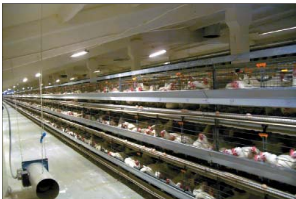
Рис. 3. Корпуса клеточного содержания ремонтного молодняка

Некоторые считают, что использовать светодиоды в сельском хозяйстве и производить осветительное оборудование на их основе