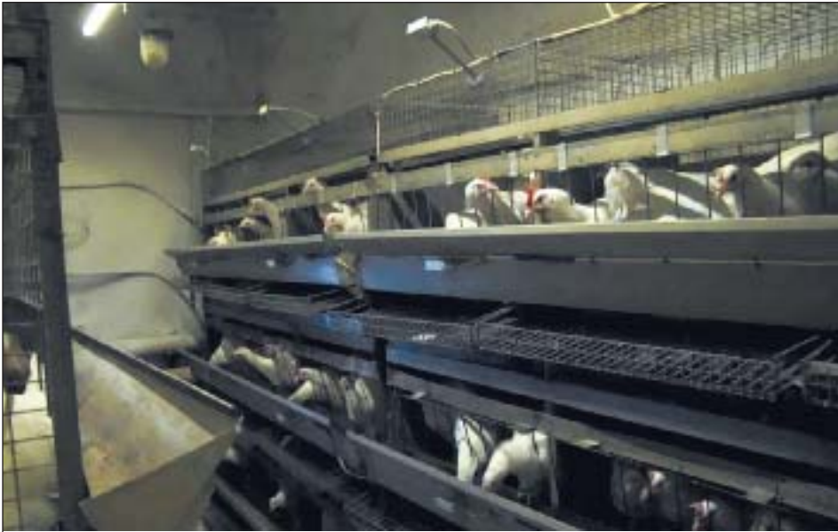
Рис. 9. Виварий Загорского экспериментального племенного хозяйства ВНИТИП г. Сергиев Посад. Исследования проводятся на оборудовании ИСО «Хамелеон»

при содержании яичных кур промышленного стада в клеточных батареях новый способ локального освещения светодиодными светильниками белого теплого спектра (2700–3500 К), по сравнению с традиционным способом, позволяет повысить: сохранность поголовья на 2,8–4,6%; яйценоскость на начальную и среднюю несущку — на 9,8–16 и 9,1–12,6%; массу яиц — на 1,9–2,9%; выход яиц категории «высшая», «отборная» и «первая» — на 1,1–1,2; 2,1–6,0 и 5,4–7,3%; выход яичной массы на начальную и среднюю несущку на 12,8–17,8 и 12,4–14,2% при снижении затрат корма на десяток яиц; 1 кг яичной массы — на 8,6–11,7 и 10,9–12,7%. Эффективность локального освещения светодиодными светильниками белого теплого спектра освещения (2700–3500 К) подтвердилась и при выращивании цыплят-бройлеров.