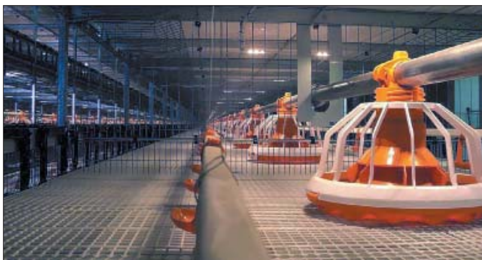
Рис. 7. Светодиодное освещение при клеточном выращивании цыплят-бройлеров

гораздо более жесткие условия эксплуатации, определяемые кратким сроком выращивания птицы и, как следствие, более частой мойкой и обработкой клеточного оборудования, расположением светильников непосредственно в клетке и их большим количеством. Все это предъявляет и более жесткие требования к светодиодному оборудованию. Светодиодные светильники и линии питания должны быть максимально изолированы от воздействия воды и химических реагентов, а сам корпус светильника должен быть герметичен и стоек к механическим воздействиям (во время мойки и выращивания птицы, особенно на последних этапах). Эти параметры должны обеспечиваться в течение всего срока службы системы светодиодного освещения. Специалисты нашей компании уделяют повышенное внимание совершенствованию оборудования этого класса. Одна из последних модификаций светильника для клеточного содержания цыплят-бройлеров успешно используется на ОАО «Птицефабрика Зеленецкая» (рис. 7). Светильники располагаются над каждой кормушкой и создают максимальный уровень освещенности до 100 лк на кормовом фронте.