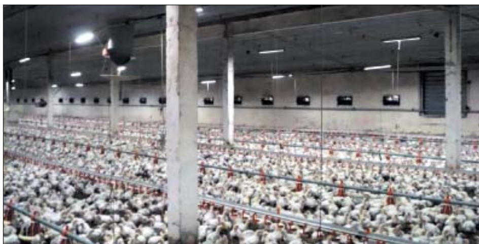
Рис. 6. Корпуса напольного содержания бройлеров на площадке Балахоновская

гораздо более жесткие условия эксплуатации, определяемые кратким сроком выращивания птицы и, как следствие, более частой мойкой и обработкой клеточного оборудования, расположением светильников непосредственно в клетке и их большим количеством. Все это предъявляет и более жесткие требования к светодиодному оборудованию. Светодиодные светильники и линии питания должны быть максимально изолированы от воздействия воды и химических реагентов, а сам корпус светильника должен быть герметичен и стоек к механическим воздействиям (во время мойки и выращивания птицы, особенно на последних этапах). Эти параметры должны обеспечиваться в течение всего срока службы системы светодиодного освещения. Специалисты нашей компании уделяют повышенное внимание совершенствованию оборудования этого класса. Одна из последних модификаций светильника для клеточного содержания цыплят-бройлеров успешно используется на ОАО «Птицефабрика Зеленецкая» (рис. 7). Светильники располагаются над каждой кормушкой и создают максимальный уровень освещенности до 100 лк на кормовом фронте.