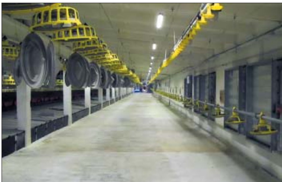
Рис. 1. Корпуса для содержания родительского стада

установлены двенадцать систем освещения ИСО «Хамелеон» для корпусов 18×120 м с родительским стадом (рис. 1). Шесть корпусов из двенадцати оборудованы светодиодными системами в начале февраля 2012 г. Результаты эксплуатации показывают, что 134 светодиодных светильника СН1050-20-120-Т мощностью 20 Вт при высоте подвеса 2,7 м полностью заменяют лампы накаливания мощностью 100 Вт в количестве 240 шт. на один корпус и обеспечивают необходимый уровень освещенности 90–95 лк. Энергопотребление при этом снижается в 8,8 раза.