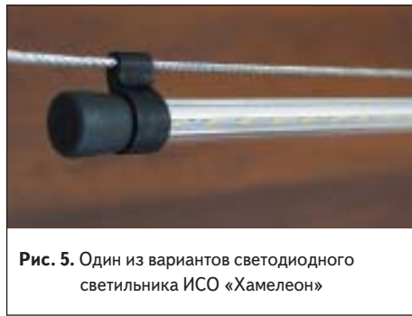
Рис. 5. Один из вариантов светодиодного светильника ИСО «Хамелеон»

Если сравнивать продолжительность работы для температур на кристалле светодиода +70 °С (точка 2) и +80 °С (точка 3), мы увидим, что возрастание температуры всего лишь на 10° приведет к сокращению срока службы светодиода примерно на 20 000 ч (более двух лет непрерывной эксплуатации). В данном случае важно то, что даже достаточно небольшое снижение температуры приводит к существенному увеличению времени жизни светодиода при фиксированном рабочем токе. Соблюдение температурного режима работы светодиода обеспечивается применением специальных технических решений, направленных на максимальное снижение разницы температур окружающей среды и светодиода. Для помещений, где содержится птица, это очень важно, так как температура в птичнике может доходить до +40...+45 °С. Наиболее экономически и технически целесообразным способом в данном случае является применение алюминиевого радиатора в конструкции корпуса светильника, на котором крепится плата со светодиодами, имеющего непосредственный контакт с окружающей средой. Таким образом здесь «отвоевается» каждый градус температуры кристалла светодиода, что позволяет максимально продлить срок его службы. Если