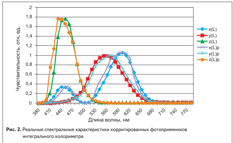
Рис. 2. Реальные спектральные характеристики скорректированных фотоприемников интегрального колориметра