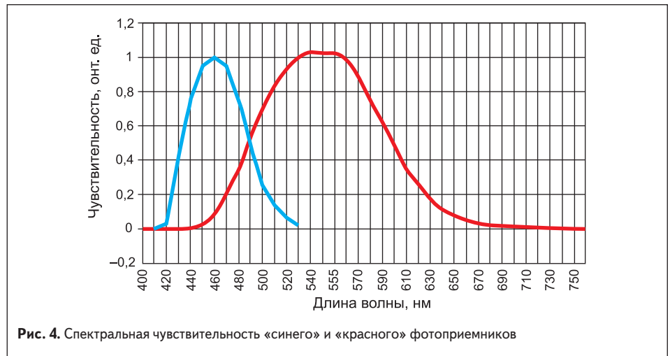
Рис. 4. Спектральная чувствительность «синего» и «красного» фотоприемников