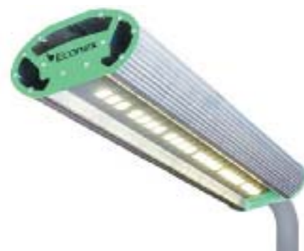
Рис. 1. Уличный светильник Econex Road

Флагманом уличного освещения торговой марки Econex уже многие годы является светильник серии Road (рис. 1). Его основные черты — минимализм и технологичность. Данная модель демонстрирует эффективность, достигающую более 100 лм/Вт. Благодаря уникальной безреберной конструкции охлаждение светодиодов происходит очень продуктивно, что дополнительно увеличивает срок эксплуатации. Современный запатентованный конструктив прибора позволяет, в случае необходимости, быстро заменить источник питания без использования специального инструмента. Еще одна особенность Econex Road — степень защиты IP67, благодаря