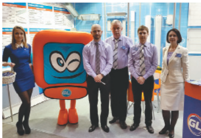
Рис. 1. Компания Good Light — неизменный участник ведущих специализированных выставок в России