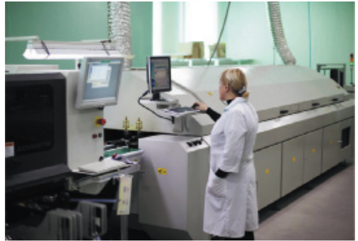
Рис. 2. Производственный потенциал компании позволяет обеспечить полный цикл изготовления светильников

выпускаемых светильников, а служба поддержки и сервиса делает все возможное для удовлетворения запросов клиентов.