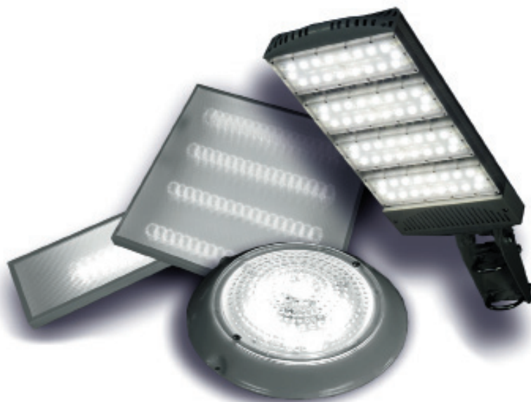
Рис. 3. Производство широкого спектра светильников технического назначения